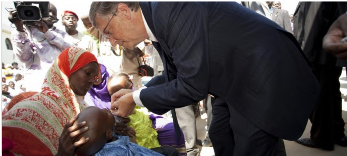
Bill Gates, cofundador e copresidente da Fundação Bill e Melinda Gates